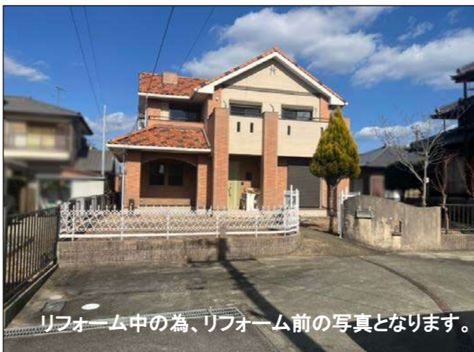
※概略図・間取り図は現況を優先とします。